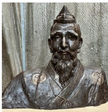
海音寺潮五郎像 と 新納忠元公像