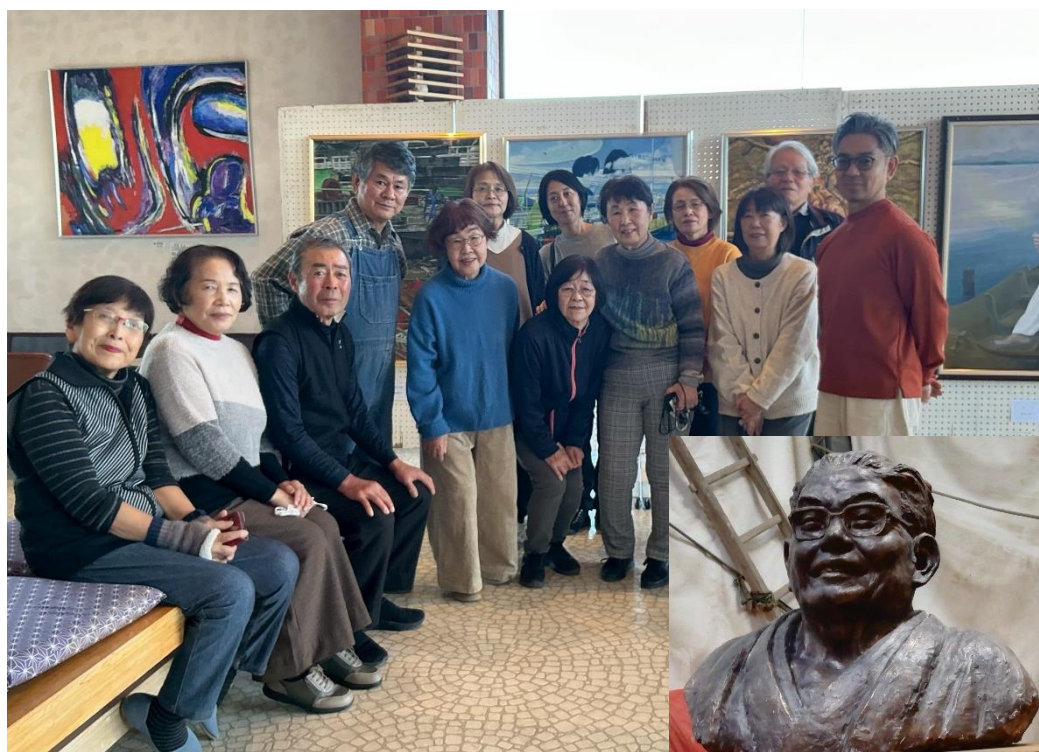
アート伊佐のメンバーと筆者で会場づくり