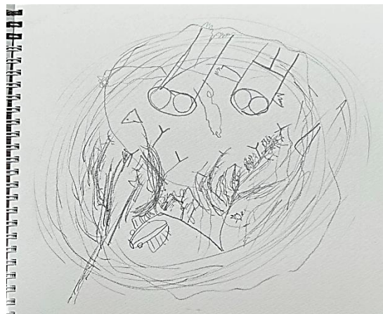
宮山治士くん作 「海へ」の記憶 / 鉛筆