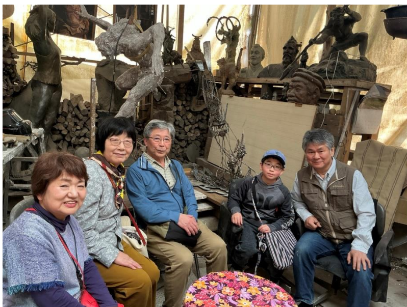
令和8年3月28日 杉アトリエにて