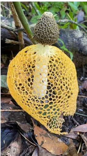
ウスキシヌガサタケ 今回は発見ならず。