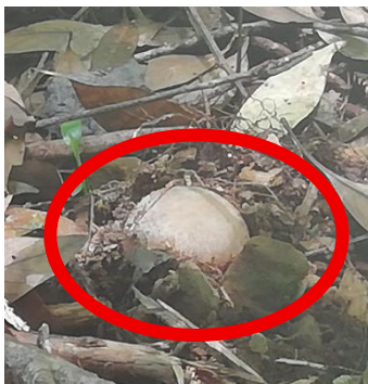
ウスキシヌガサタケの タマゴ (2026.6.13.)